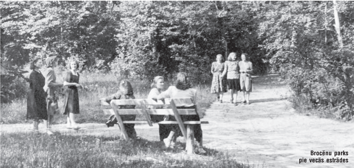
Brocēnu parks pie vecās estrādes

Tagad šīs mājas sauc par "Ezernaļiem". Agrāk tās sauktas par "Buliem" un kapi par Bulu kapiem. Teika stāsta, ka reiz bula laikā naktī kāds ceļinieks gājis gar šīm mājām un ezermalā ieraudzījis mucu ar zeltu. Muca viņam likusi teikt trīs vārdus. Ja ceļinieks pateiks pareizos, tad visi šī novada ļaudis dzīvos pārticībā. Ceļinieks nav varējis pateikt pareizos, un muca ievēlusies ezerā. Tanī vietā no tā laika radies stāvs krasts ar dziļu gultni pie tā. Veļoties ezerā, muca teikusi, ka viņa atkal parādīsoties pēc simt gadiem. Tāpēc mājas nosauktas par "Bulu" mājām, jo viss notika bula laikā.