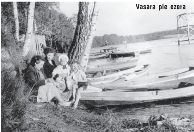
Vasara pie ezera

Ūdeņi reizēm novērojama ūdens ziedēšana, ir bijusi novērojama notekūdeņu izplūde ezerā ietekošajā Ciecērē, bet no 1992. gada ezerā sadzīves notekūdeņi neieplūst. Iespējams, no ezera izplūst neattīrīti notekūdeņi no Brocēnu Atdzelšanas stacijas. Būtu vēlams popularizēt un atjaunot kempingus, sakopt peldvietas ap ezeru, lai viegli piekļūtu arī citās vietās, atjaunot laivu nomas staciju, pilnveidot pludmali pilsētas teritorijā, neaizbūvēt krasta teritoriju ar privātmāju īpašumiem tā, ka netiek skaidstajam ezeram klāt!