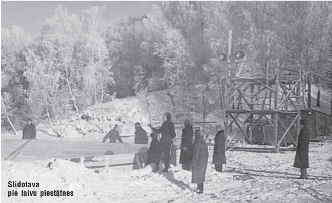
Slidotava pie laivu piestātnes